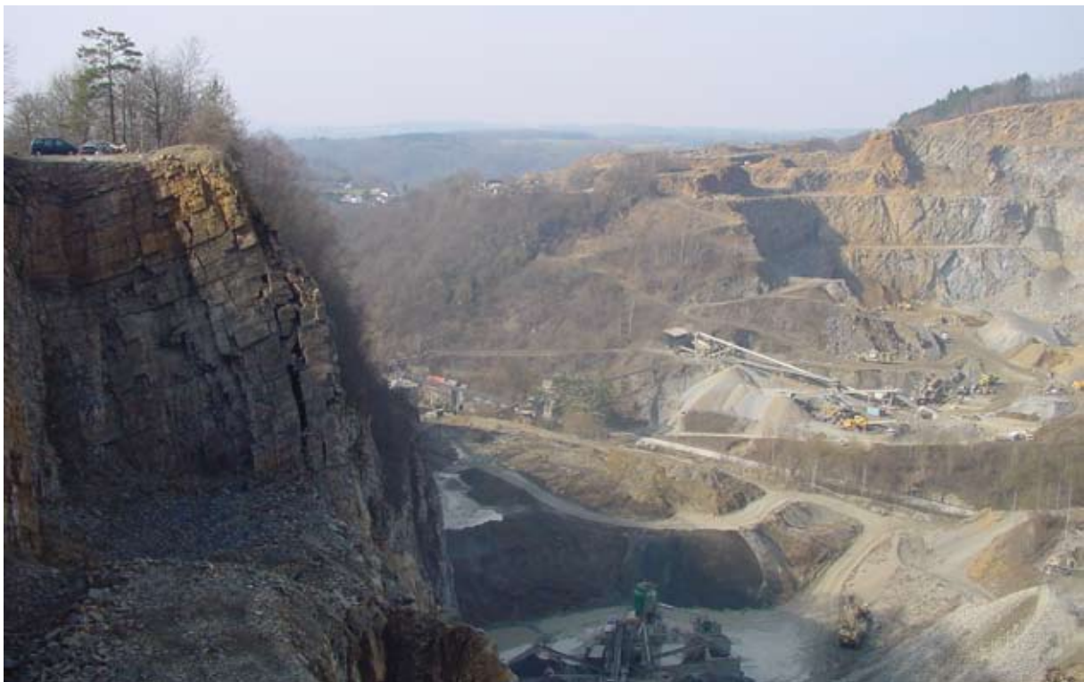
Fronts de carrières de la vallée du Bocq à Yvoir.

Parmi les différentes sources de données identifiées (tels que les plans de secteur, les natures cadastrales du PLI ou la convention sur les carrières de grand intérêt biologique en Région wallonne ...), et dont l'expertise s'est attachée à préciser la disponibilité et en évaluer