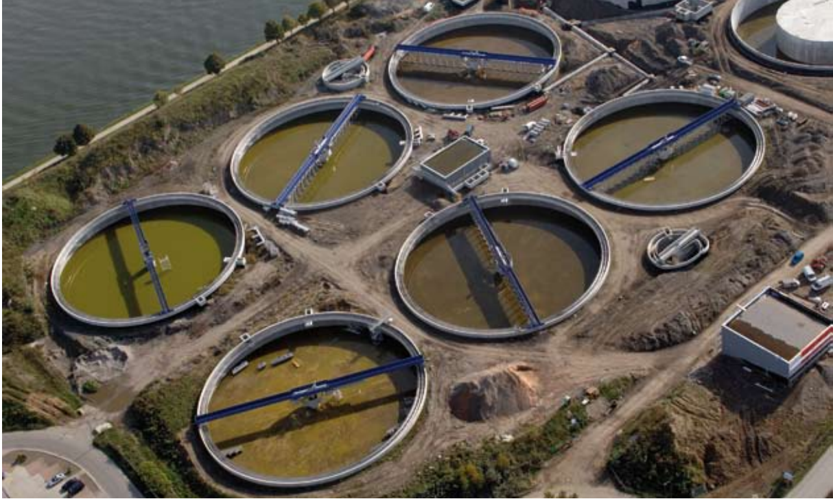
La pierre est utilisée dans l'épuration des eaux. Station d'épuration d'Hermalle-sous-Argenteau.

zones d'extraction du plan de secteur sont suffisantes ; un exploitant déclare des réserves supérieures à mille ans ! (Incitec, 2006).