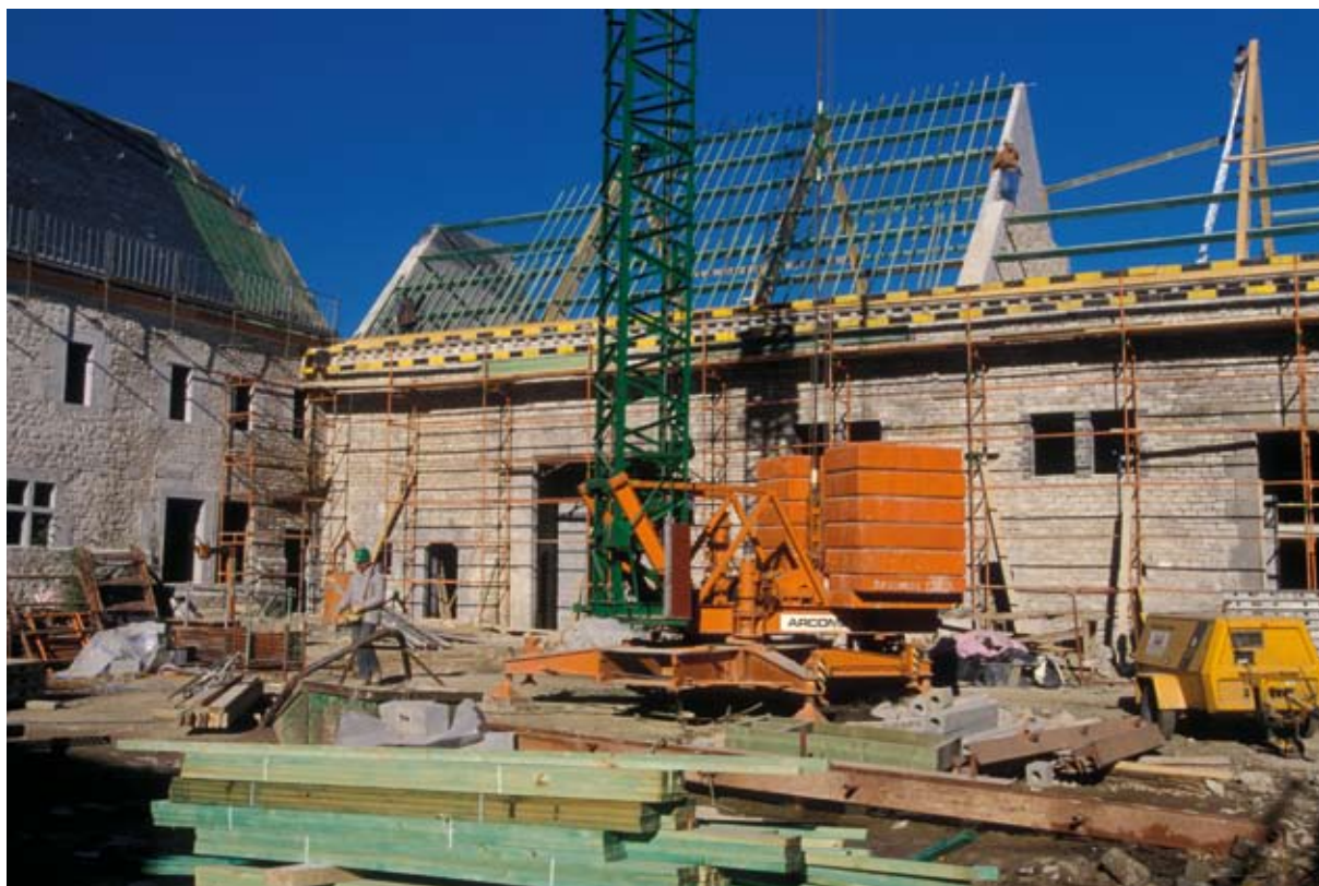
La vitalité du secteur extractif est directement liée à celle du secteur de la construction. Rénovation de bâtiments à Anthisnes.

La réalisation d'un plan stratégique « zone d'extraction » au niveau de la Wallonie permettrait de répondre en une seule fois à ces deux constats.