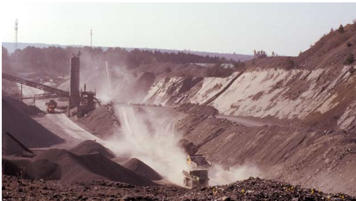
Carrière des Limites à Wellin.

Cette consommation d'espace pourrait dès lors être surveillée et vérifiée par l'intermédiaire du PPNC et d'un logiciel de SIG et, enfin, validée par une visite de terrain.