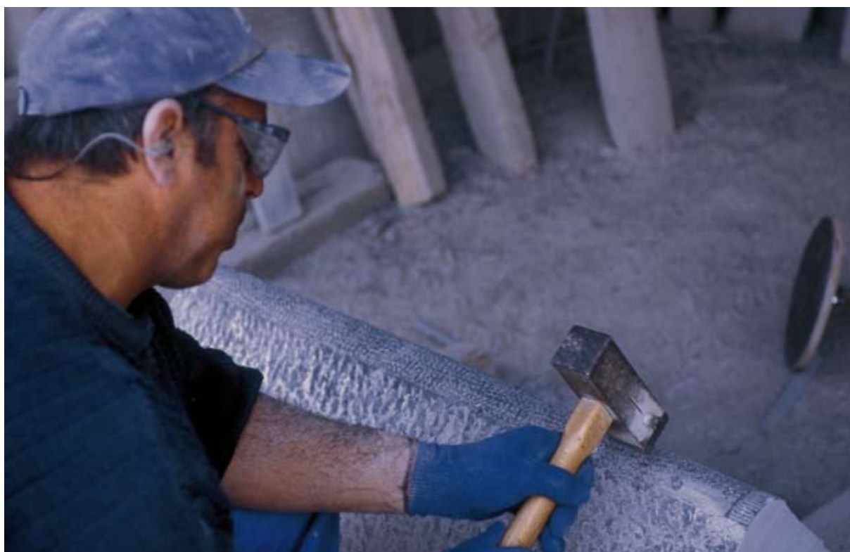
La pierre ornementale a toujours fait la réputation de la pierre wallonne en Belgique et à l'étranger. Carrière du Met à Sclayn.

L'extraction et le traitement de la pierre ornementale ont toujours fait la réputation de la pierre wallonne en Belgique mais également à l'étranger. Actuellement, la demande n'est pas satisfaite, la diversité est en baisse et certains produits « historiques » doivent être importés (ardoises, par exemple). La disponibilité de la ressource n'est pas en danger actuellement, sauf exceptions, les