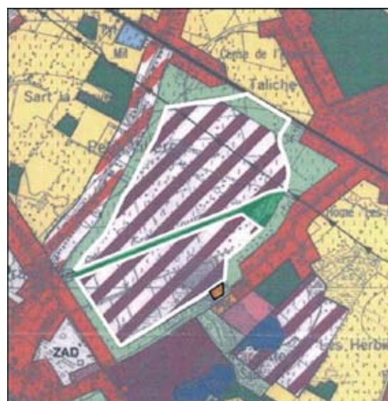
Révision du plan de secteur à Saint-Ghislain : extension de la zone d'extraction.