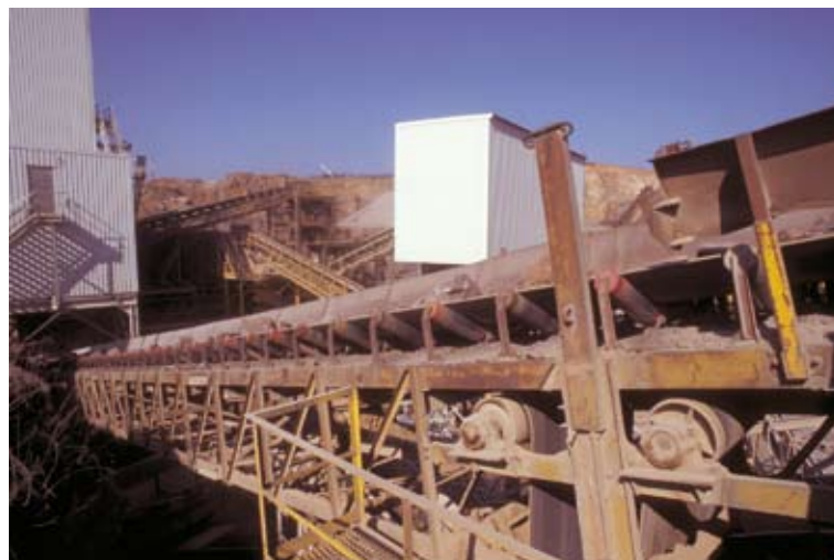
Le secteur des granulats subit de plein fouet la concurrence des produits d'importation. Carrière Gralex à Beez.

Aucune donnée fiable n'est cependant disponible pour suivre et évaluer annuellement la consommation de l'espace et des ressources par les activités extractives. Chaque carrière étant différente (mode d'exploitation, puissance du banc, pureté du banc...), il est impossible de transformer les chiffres de production annuelle en superficie. L'état des lieux réalisé par l'étude Poty est la donnée la plus récente disponible (2001) ; malheureusement aucune mise à jour n'a été effectuée depuis lors. Pour appréhender sommairement un état des lieux de la consommation de l'espace et des ressources, une approche quantitative est actuellement impossible.