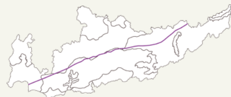
— Tracé de la chaussée romaine