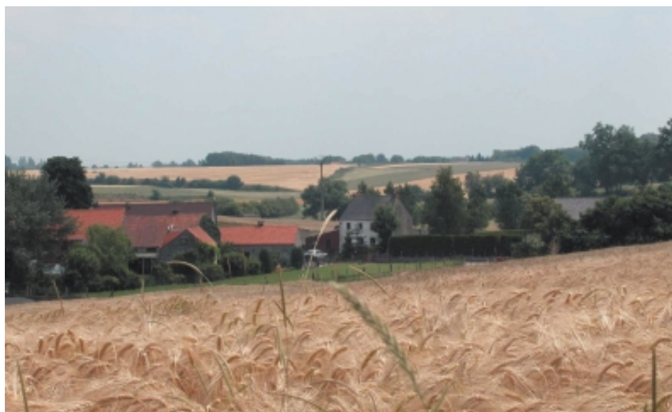
Bas-plateaux limoneux brabançon et hesbignon - Faciès hesbignon brabançon (03012)

A l'est des vallonements de la Dyle, le plateau hesbignon brabançon est caractérisé par un relief mollement ondulé modelé par un réseau hydrographique relativement dense. Les villages qui s'y sont développés ont tendance, de nos jours, à s'étaler le long des axes routiers. Enfin, si certaines fermes se maintiennent dans les villages, la plupart sont disséminées dans les campagnes que ponctuent les deux petites villes de Perwez et Jodoigne.